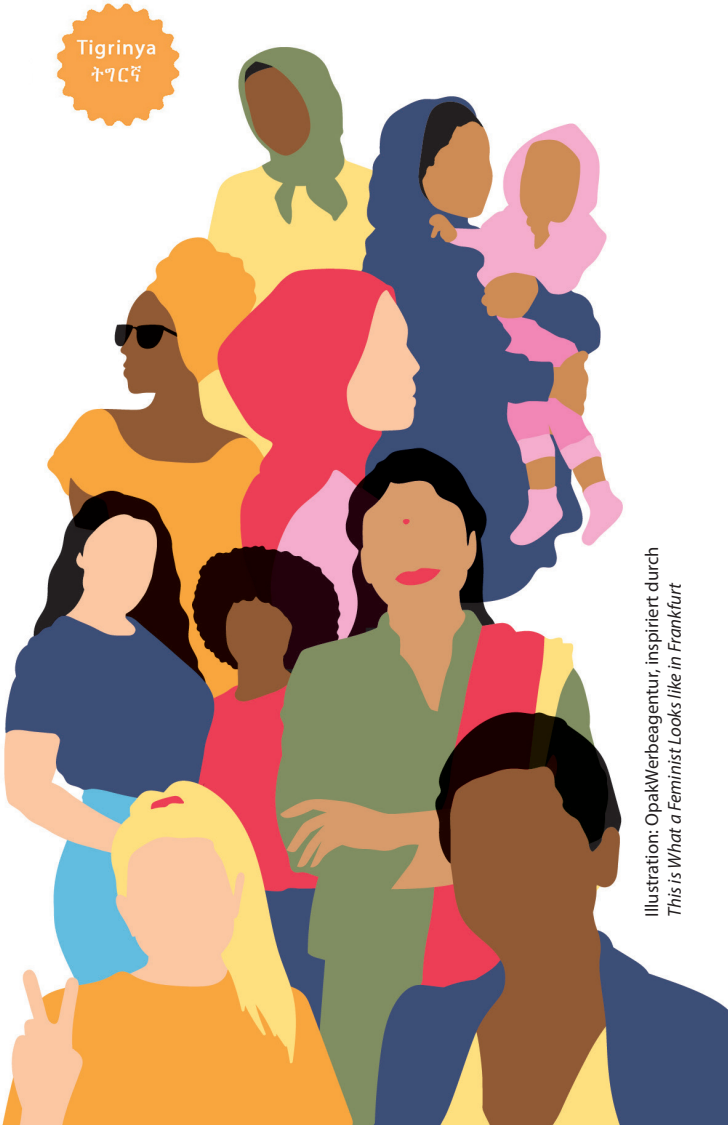
Illustration: OpakWerbeagentur, inspiriert durch This is What a Feminist Looks like in Frankfurt